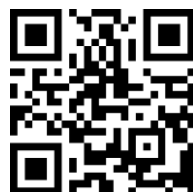
Группа ВК «Школа здоровья»